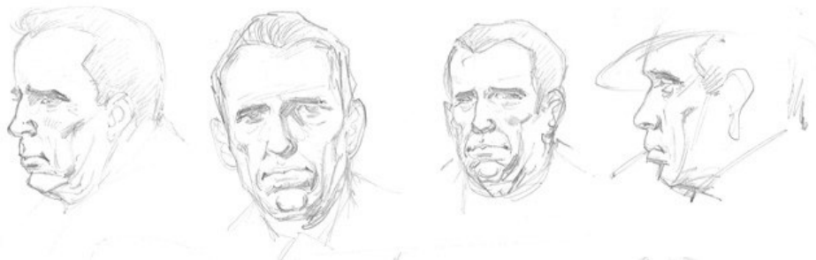
Sam : James Dean