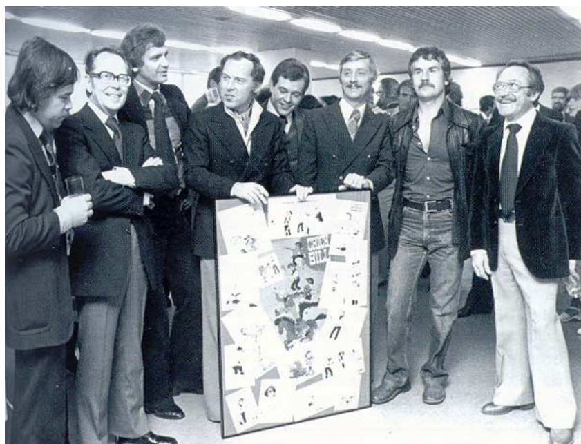
Walthéry, Morris, Dany, Tibet, De Groot, Géri, Hermann, Paape, 25 ème anniversaire de Chick Bill

En 1973, pour le 20 ème anniversaire de la série « Chick Bill », voici comment aurait été le personnage sous le crayon d'Hermann. Un hommage sera à nouveau rendu cinq années plus tard à Tibet, le dessinateur de Chick Bill.