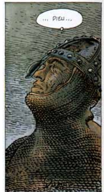
Place au doute (William)

Parmi les horreurs qu'Hermann met en scène, il y a celles comises par les Croisés sur la route de l'Orient. Bois-Maury et ses compagnons vont en payer le prix fort dans l'album William : excédés par les exactions (pillages, viols, etc.) des précédentes expéditions de Croisés, des villageois les accueillent avec méfiance. Cette méfiance n'est qu'hostilité déguisée, la fin de l'histoire se terminant dans le sang, les cendres et les larmes. Pour la première fois, le chevalier de Bois-Maury lèvera les yeux au ciel et s'interrogera sur la nature de Dieu. Un doute sans lendemain qui en dit long sur ce que pense Hermann de ce qu'on attribue de bonté et de justice à Dieu et de ce qu'en font les hommes.