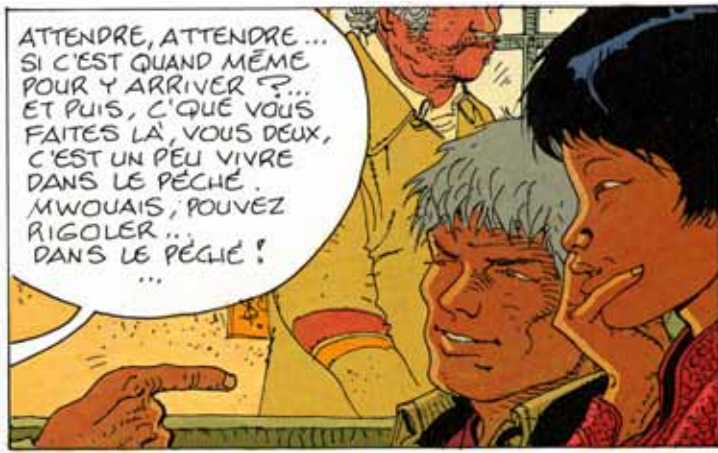
Gare au péché (Boomerang)

Nous sommes en 1981, et si le monde découvre le fondamentalisme musulman avec incrédule, ce sont les sectes occidentales qui marquent les esprits et qu'Hermann a dans le collimateur : le massacre de la secte de Jim Jones s'est produit moins de trois ans plus tôt et les meurtres de la Famille de Manson ne