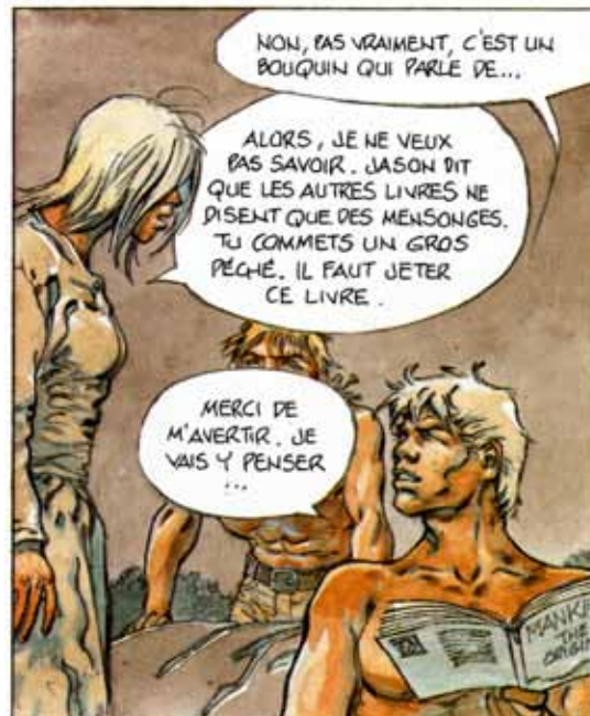
(Un port dans l'ombre)