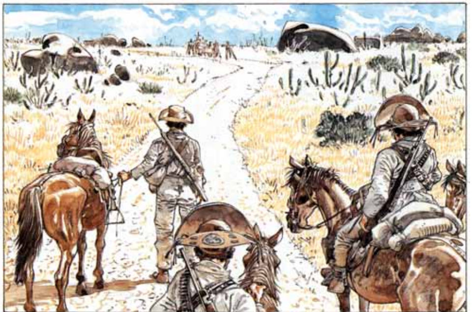
Fanatisme religieux (Caatinga)

Bien sûr, on pourrait encore joindre Sarajevo Tango au dossier mais l'aspect religieux du conflit n'étant pas véritablement abordé par Hermann, nous le laisserons donc de côté.