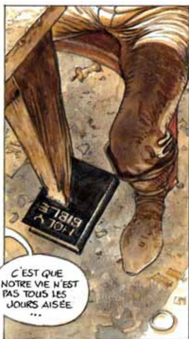
Bible tous usages (Mercenaires)

Dans les premières pages de Qui est Renard Bleu ? , Hermann met en scène un prédicateur comme il en existe tant aux Etats-Unis. En insistant bien entendu sur le ridicule du personnage mais encore plus sur la naïveté et la bêtise du gentil troupeau qui l'écoute la larme à l'œil et le portefeuille à fleur de peau. Dans le même album, Hermann nous offre une scène cocasse montrant Kurdy, perdu dans ses pensées, qui dépose par inadvertance un billet dans le panier d'un quêteur habillé en ange qui recueille les dons en faveur de l'église du prédicateur. S'apercevant de la méprise, Kurdy rappelle l'ange, sans succès. Nul doute qu'on ne l'y reprendra plus !