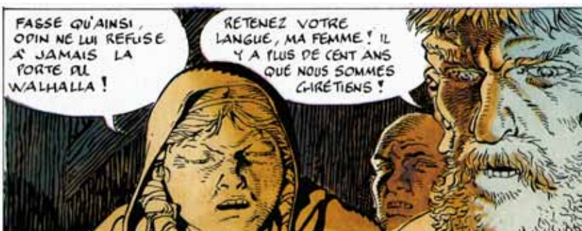
Au bûcher, les dieux d'antan (Sigurd)

Si Dieu n'est que la somme de ce que les hommes lui attribuent, chaque religion a tôt fait d'imposer sa vérité à ceux qui n'y adhèrent pas. Et comme une religion est une idéologie politique, certes prétendument d'émanation divine, elle a besoin, comme toute idéologie, de croître pour prospérer et montrer sa force. Plus une religion est puissante, plus elle a des vues hégémoniques sur les religions plus faibles. De cette soif de puissance sont nées les guerres de religions. Dans Sigurd , le christianisme a récemment pris le pas sur les croyances scandinaves. Messire Landri rappelle à l'ordre sa femme alors qu'elle invoque les dieux païens : craint-il la colère de Dieu et celle de l'appareil répressif de l'Eglise ou est-il hom-