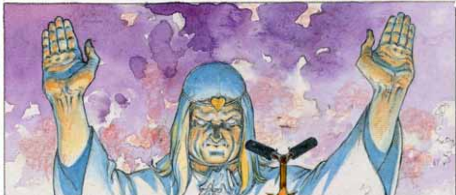
Le berger et son troupeau (Qui est Renard bleu ?)

Beaucoup plus inquiétante (quoique) est la communauté repliée sur elle-même qui est représentée dans Un port dans l'ombre . Dirigés par Jason, leader politique et religieux bien qu'il n'en porte aucun signe extérieur, ses membres lui obéissent au doigt et à l'oeil : la peur de Dieu est un aiguillon millénaire mais il n'y pas de comportement plus inintelligible que celui qui nous détourner de la raison pour nous réfugier dans les ténèbres de l'ignorance. Le fanatisme et l'aveuglement de cette communauté fait froid