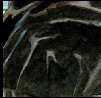
3 - T2, p.2 c.4