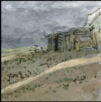
1 - T3, p.25 c.1