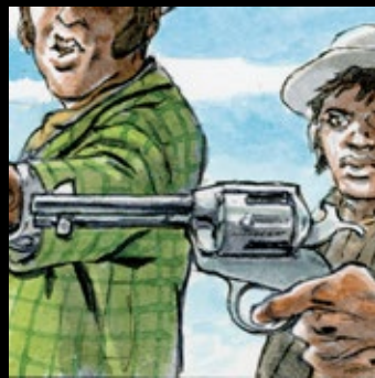
4 - T3, p.32, c.7