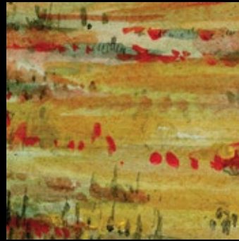
2 - T1, p.27 c.6